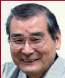
Sensei Yoshida Partenaire de LEAN TRAINING®