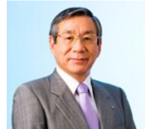
Haruka Nishimatsu (1949-), Japon

Nishimatsu, qui se considère sur-médiatisé, déclare que, pour lui, partager les difficultés avec ses salariés est une chose normale.